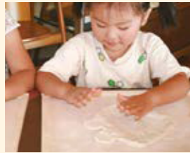
テーブルで生地をのぼす